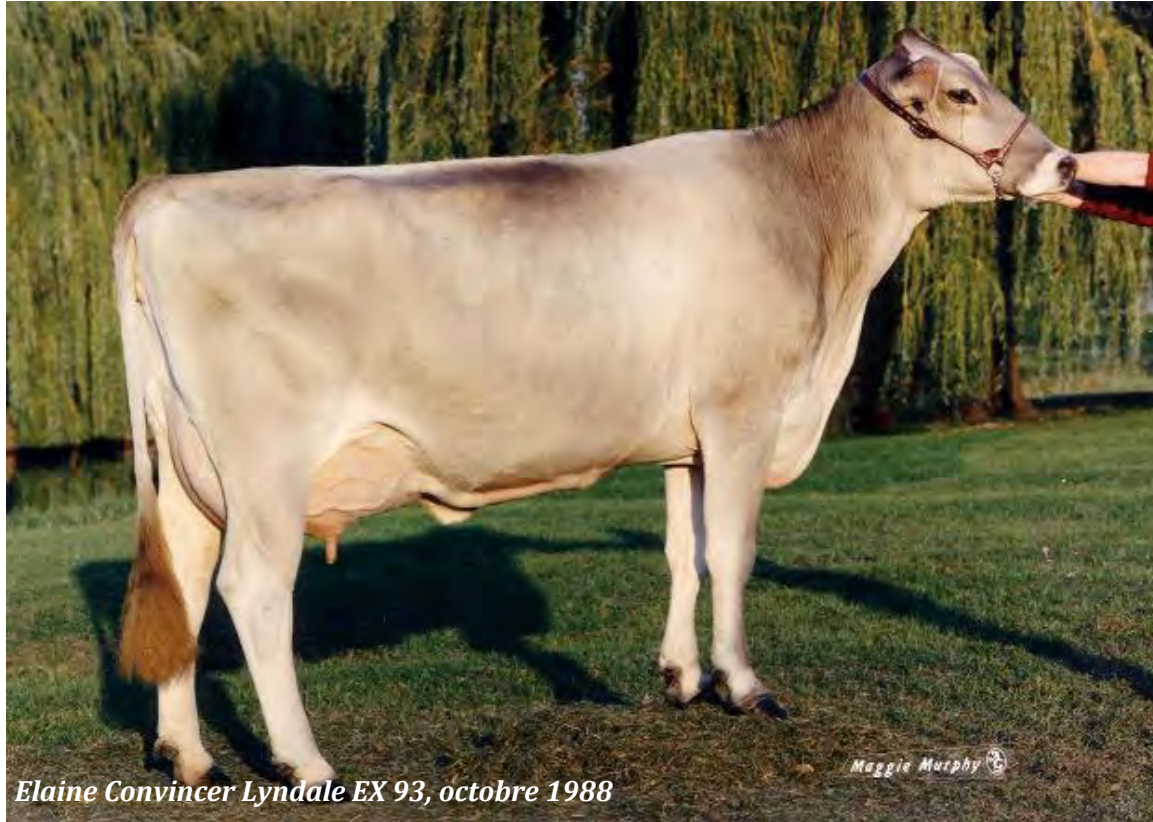
Elaine Convincer Lyndale EX 93, octobre 1988

Aujourd'hui, il ne reste que deux branches vivantes connues de cette famille. Les Brattlands dans le Minnesota ont construit une très belle famille de vaches descendues de Jane la 4 e . Il y a aussi une grande famille à travers les États-Unis et le Canada découlant de la 3 e Jane. Cette branche a donné Lyndale Convincer Elaine (Ex-93) qui est la seule vache Suisse Brune à avoir réussi, deux fois à décrocher le titre de Championne Suprême dans l'histoire de la World Dairy Expo.