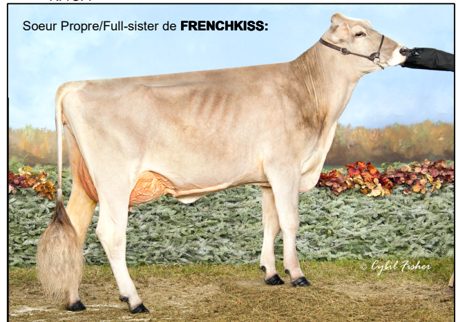
Soeur Propre/Full-sister de FRENCHKISS:

BSCHEM120094290070 Born/Né: 22-09-12 (4/18) GMACE LPI/IPV MACEG: 1919 I/C: 5.36% R/P: 12% CAN-GMACE/MACEG Rel/Fiab: 86% M/L: 289 F/G: 25 P: 34 (4/18) SCS/CS: 2.88 DF/FF: 102 %F/G: +0.13 %P: +0.25 CAN-GMACE/MACEG Rel/Fiab: 83% CONF: 14 HL/DV: 108 (4/18) MS/SM: 8 FL/PM: 8 DS/PL: 11 RP/C: 14