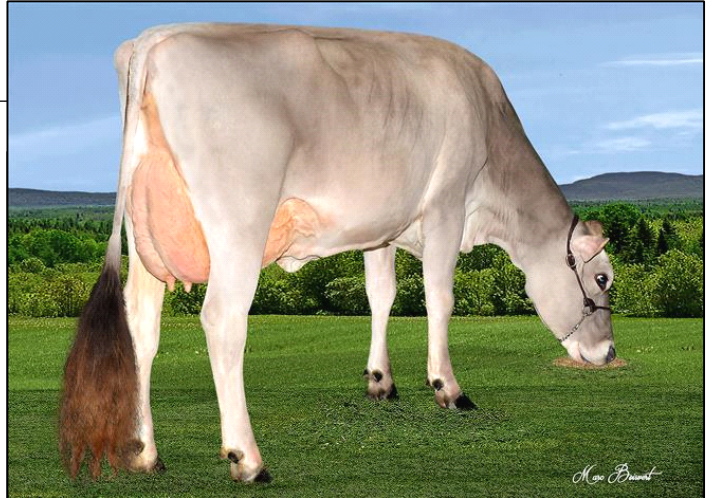
mère / dam - BROWN HEAVEN BLOOMING BUNNY ET VG/TB-88

BS840M3129321096 Born/Né: 29-08-15 (4/18) GPA LPI/IPV MPG: 1757 I/C: 11.84% R/P: 19% CAN-GPA/MPG Rel/Fiab:56% M/L: 155 F/G: 15 P: 14 (4/18) SCS/CS: 2.74 DF/FF: 100 %F/G: +0.09 %P: +0.09 CAN-GPA/MPG Rel/Fiab: 50% CONF: 16 HL/DV: 108 (4/18) MS/SM: 16 FL/PM: 10 DS/PL: 8 RP/C:6