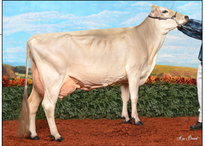
2 e mère / 2 nd dam - BROWN HEAVEN TRACT SWEET DALLY Ex-91-3E 1 er 5ans & Res Grande Champ Suprême Laitier 2016

BSCHEM120081082091 Born/Né: 03-12-09 (4/18) GMPACE LPI/IPV MACEG: 1381 I/C: --% R/P: --% CAN-GMACE/MACEG Rel/Fiab: 80% M/L: 744 F/G: 13 P: 22 (4/18) SCS/CS: 2.94 DF/FF: 93 %F/G: -0.22 %P: -0.05 CAN-GMACE/MACEG Rel/Fiab: 76% CONF: 8 HL/DV: 102 (4/18) MS/SM: 7 FL/PM: 5 DS/PL: 5 RP/C: 5