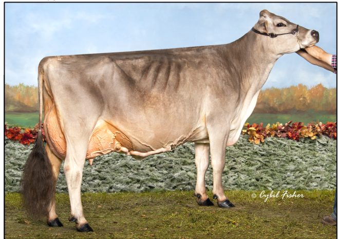
Demi-soeur/Half-sister de FLOWER: BROWN HEAVEN GLENN FANTASY Ex-97-2E

BSCHEM120103987212 Born/Né: 11-07-12 (04/18) GMACE LPI/IPV MACEG: 1570 I/C: 4.06% R/P:12% CAN-GMACE/MACEG Rel/Fiab:80% M/L:376 F/G:27 P:33 (04/18) SCS/CS:3.33 DF/FF:96 %F/G:+0.12 %P:+0.22 CAN-GMACE/MACEG Rel/Fiab:79% CONF:10 HL/DV:99 (04/18) MS/SM: 11 FL/PM:4 DS/PL: 7 RP/C: 5