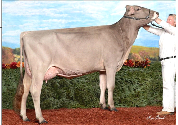
Mère / Dam - MILEC TRACTION BERLINE ET VG/TB-86

BSUSAM71130650 Born/Né: 15-01-12 (4/18) GEBV LPI/IPV VÉEG: 2219 I/C: 10.78% R/P: 19% CAN-GEBV/VÉEG Rel/Fiab: 75% M/L: 765 F/G: 30 P: 28 (4/18) SCS/CS: 2.77 DF/FF:102 %F/G: -0.03 %P: +0.06 CAN-GEBV/VÉEG Rel/Fiab: 72% CONF: 16 HL/DV: 106 (4/18) MS/SM: 10 FL/PM: 6 DS/PL: 9 RP/C: 6