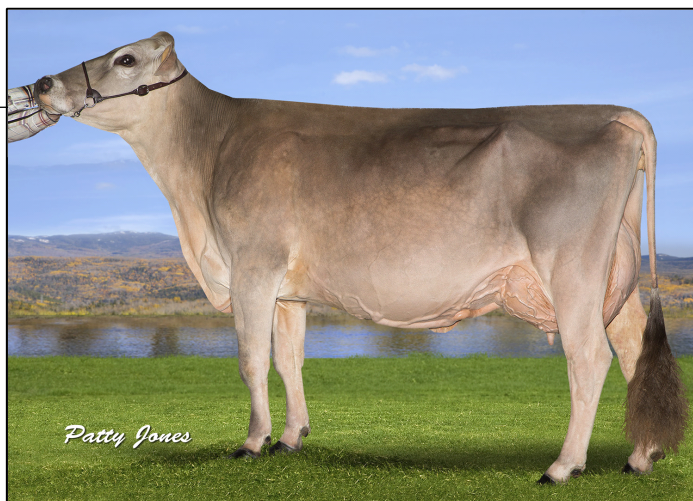
2 e mère / 2 nd dam - BROWN HEAVEN J BUTTERFLY Ex-92

(4/18) MS/SM: 6 FL/PM: 9 DS/PL: 10 RP/C:-1