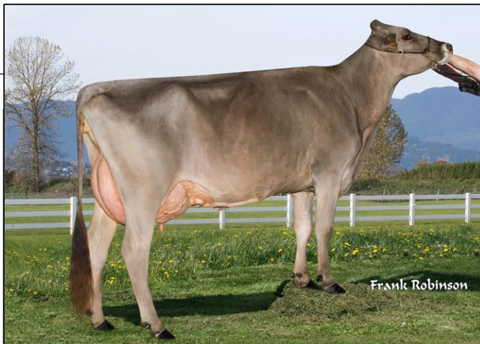
2 e mère / 2 nd dam - BROWN HEAVEN GRIFFIN TOOTIE Ex-92-3E

(4/18) MS/SM: 8 FL/PM: 8 DS/PL: 11 RP/C: 14