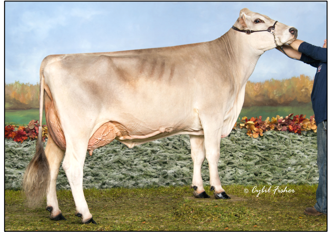
mère / dam - BROWN HEAVEN J FANCY ET Ex-90

BSCHEM120103987212 Born/Né: 11-07-12 (04/18) GMACE LPI/IPV MACEG: 1570 I/C: 4.06% R/P:12% CAN-GMACE/MACEG Rel/Fiab:80% M/L:376 F/G:27 P:33 (04/18) SCS/CS:3.33 DF/FF:96 %F/G:+0.12 %P:+0.22 CAN-GMACE/MACEG Rel/Fiab:79% CONF:10 HL/DV:99 (04/18) MS/SM: 11 FL/PM:4 DS/PL: 7 RP/C: 5